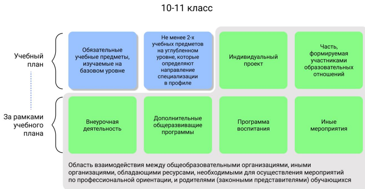
Рисунок 1 – Единая модель профориентации в профильных предпрофессиональных классах – область взаимодействия между общеобразовательными организациями и партнерами

Разработка основной образовательной программы для профильных предпрофессиональных классов проводится с учетом мнения всех категорий участников Единой модели профориентации, представленных на уровне субъекта Российской Федерации, муниципалитета.